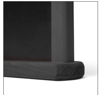
Table Top Chalkboard

Stained hardwood with matt varnish protection • 3 colours • double-sided laminate chalkboard panels • HPL high pressure laminate surface blackboards