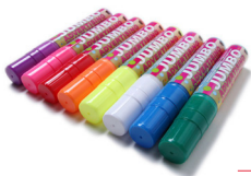
SCRITTO® CHALKMARKERS KREIDESTIFTE